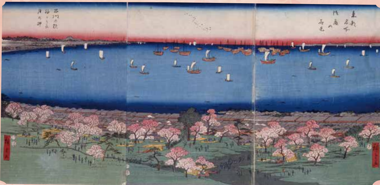
歌川広重(初代)「東都名所 御殿山花見 品川の駅 袖かうら 月の岬」(品川区立品川歴史館所蔵)